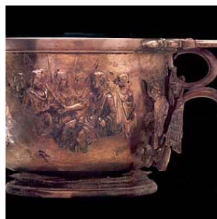
Coppa "di Augusto"