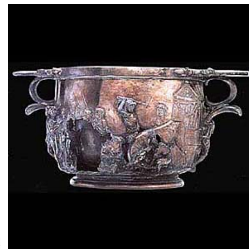
Coppa "di Tiberio"