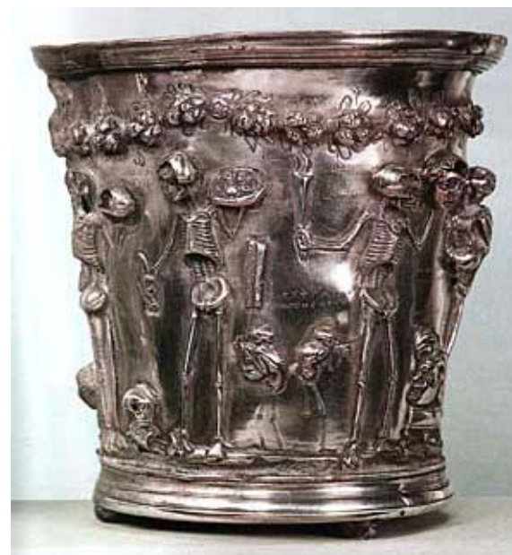
Coppa degli scheletri