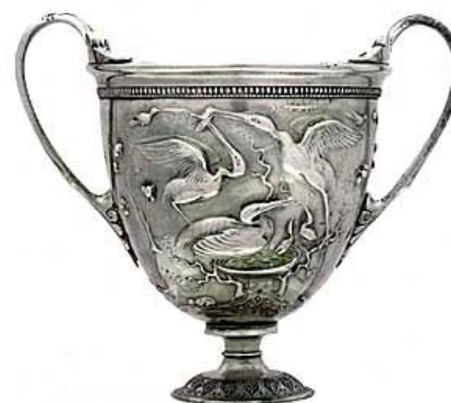
Coppa delle cicogne